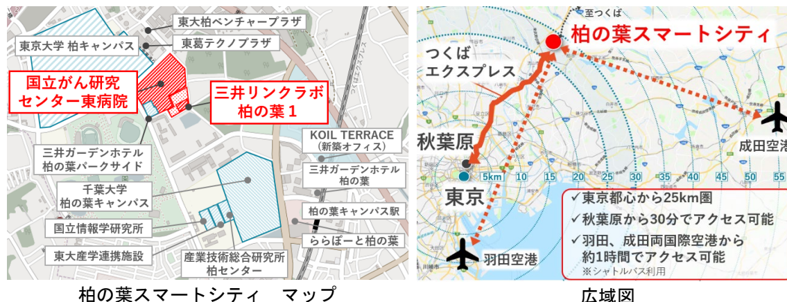
柏の葉スマートシティ マップ