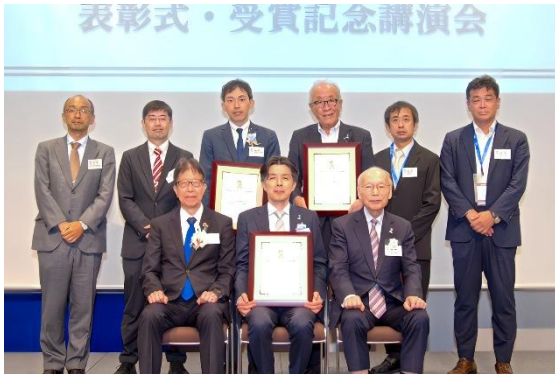
表彰式の様子（25年10月開催）

今回、受賞対象となった業績は「In situ 組織再生を実現する心・血管修復パッチの開発と実用化」です。小児用医療機器の開発という難しい課題に対して、大阪医科薬科大学のアカデミアとしての解決アイデア、福井経編興業の革新的な繊維加工技術、帝人の製品開発力を結集して心・血管修復パッチ「シンフォリウム」を創出したこと、現在は国内で200名以上の患者に使用されていること、さらには海外展開も進めている日本発イノベーションであることを高く評価されました。